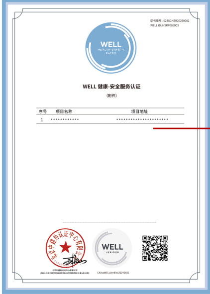
未现场审查项目信息

项目所有企业 与平台企业名称、申请书甲方名称一致 项目信息 与平台信息一致， 与证书信息确认表（现场审查时提供）信息一致